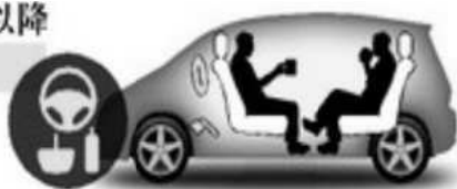
2020年代後半以降 すべて自動化

ツールとして発展してきました。しかし2020年の実現を目指す、世界各国で取組が進められている5G(第5世代移動通信システム)は通信速度が4Gの100倍になります。すなわちスマホ、パソコンをはじめあらゆるものがインターネットに接続できる「多数同時接続」、利用者が遅延(タイムラグ)を感じることのない「超低遅延」の特徴を活かし人間の生活が大きく変わるでしょう。