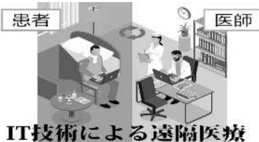
IT技術による遠隔医療