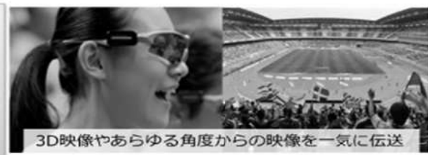
3D映像やあらゆる角度からの映像を一気に伝送